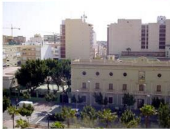
Centro educativo La Salle

TELEPRENSA. Una pirueta que debía realizar junto a sus compañeros para formar una figura gimnástica, un ejercicio acrobático parte de la actuación que preparaba para la fiesta de las Cruces de Mayo, mantiene a un alumno del centro educativo La Salle Virgen de Mar, en Almería, en la Unidad de Cuidados Intensivos del complejo hospitalario Torrecárdenas.